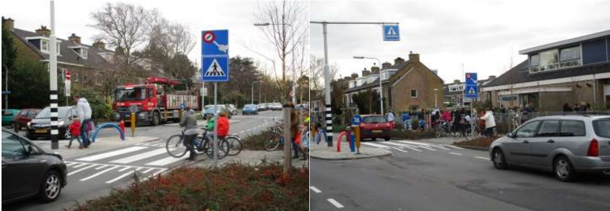
St. Jan Baptist school