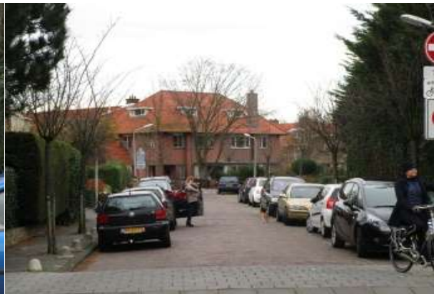
Gladiolusstraat/Narcisstraat Tevens sluiproute om het Rozenplein