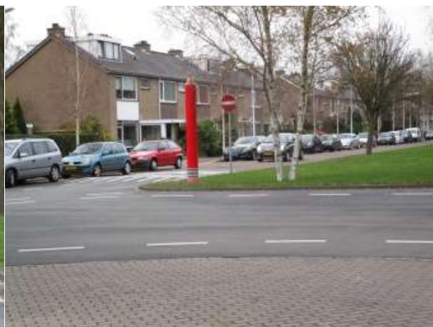
Klinkerweg (Anemonenweg) Overlast voor doorgaand verkeer èn sluiproute om het Rozenplein