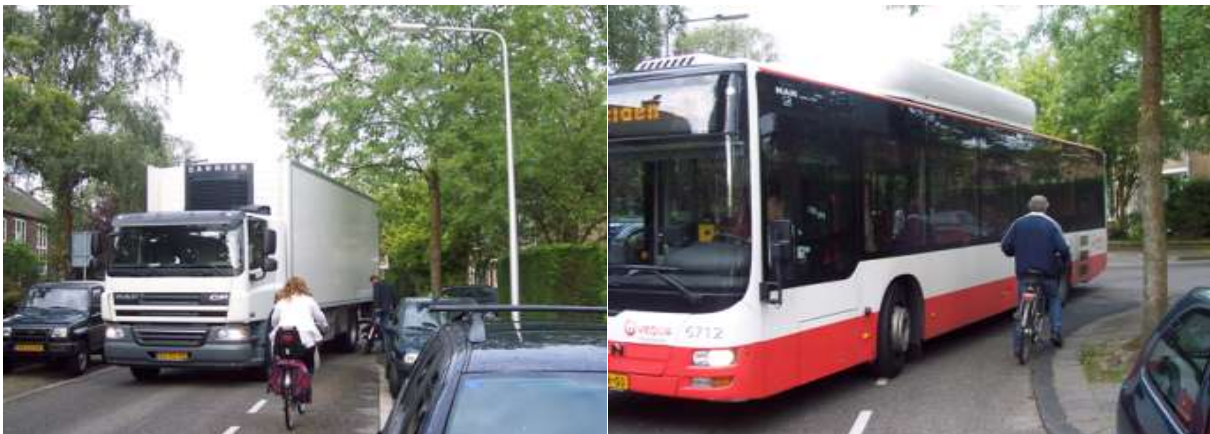
De Bocht van Cranenburchlaan/Violierenweg