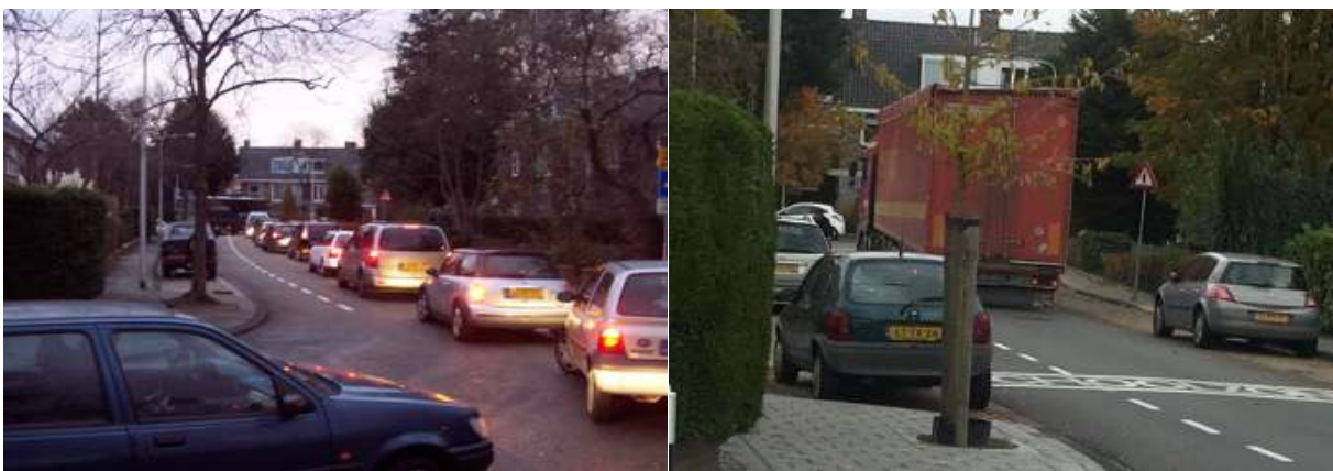
Smalle Violierenweg . Overlast door doorgaand verkeer en sluiproute om het Rozenplein.